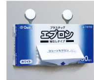
フックで壁掛け可能(30枚)