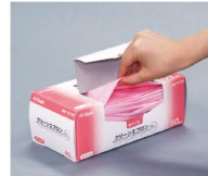
1枚ずつ取り出しやすい!