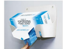
オオサキPPEホルダーにぴったりと収まります。